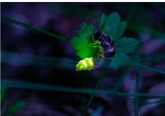
Grosses Glühwürmchen