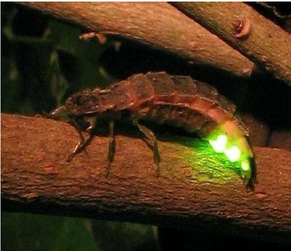
Weibchen des Grossen Leuchtkäfers beim nächtlichen Leuchten zur Anlockung von Männchen